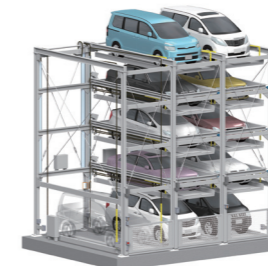
TPJ 型 地上3~5段方式 (昇降横行式)