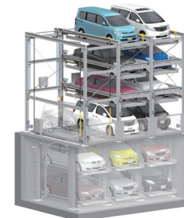
TPL 型 地上1~4段/ 地下3~1段方式 (昇降横行式・ビット式)