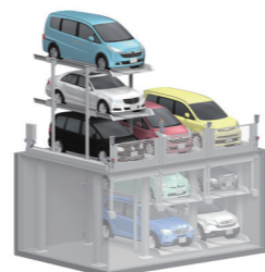
TPG 型 3段方式 (昇降式・ビット式)