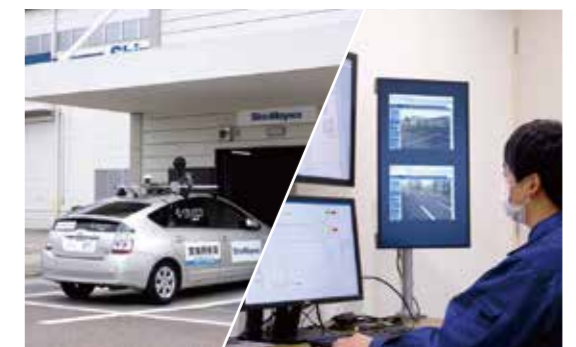
未来のモビリティ社会実現への取り組み

電気自動車、水素自動車の普及や 自動運転関連の技術革新に代表される 世の中の目まぐるしい変化を的確に捉え 未来に役立つ技術を開発しています。